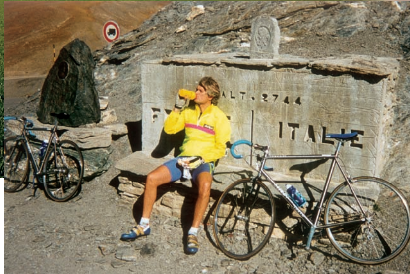
TOP, DRACONE TAKING A BREAK. IN ALTO, DRACONE DURANTE UNA SOSTA. Слева направо: Драконе во время остановки.