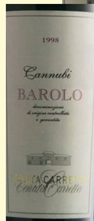
TOP, THE CELLAR AND THE MAP. SIDE, SOME WINE LABELS. IN ALTO, LA CANTINA DELLA TENUTA E LA CARTINA STRADALE. A FIANCO, LE ETICHETTE DEI VINI PRODOTTI