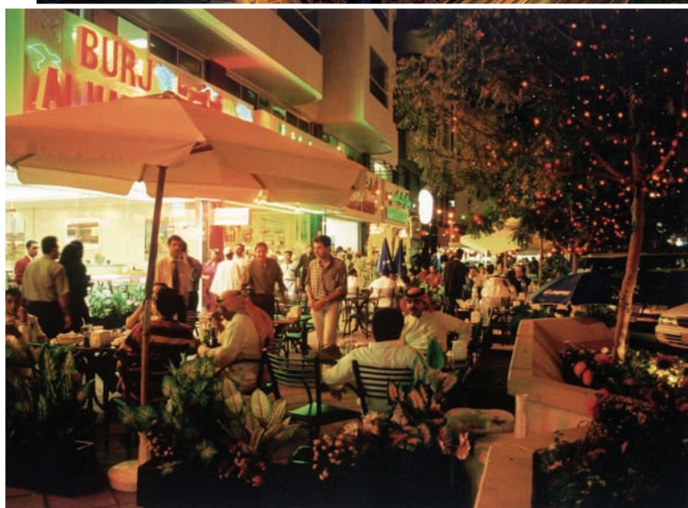
ABOVE, DUBAI BY NIGHT. SIDE, THE NIGHT LIFE IN ALTO DUBAI DI NOTTE. A LATO UN PARTICOLARE DI VITA NOTTURNA Дубай ночью. Рядом: сцена ночной жизни